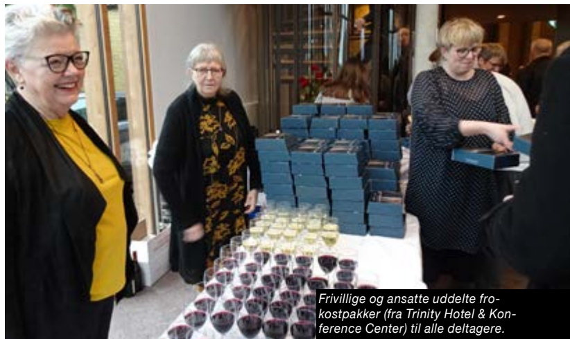
Frivillige og ansatte uddelte frokostpakker (fra Trinity Hotel & Conference Center) til alle deltagere.