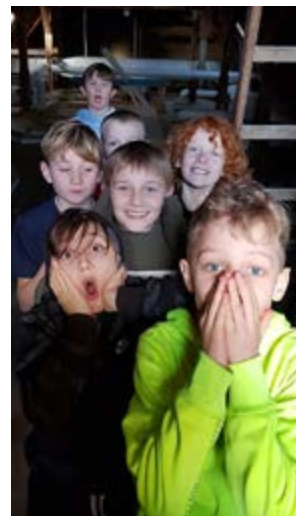
Glimt fra livet i Christianskirken