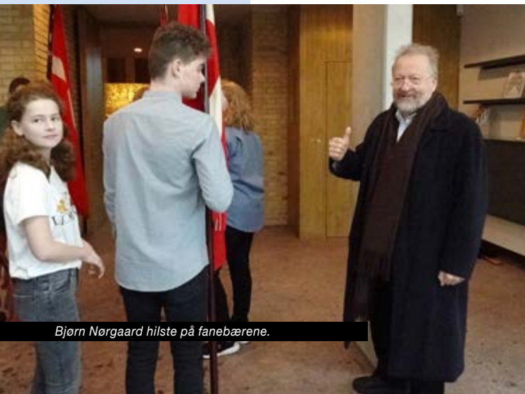
Bjørn Nørgaard hilste på fanebærerne.